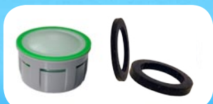
2 régulateurs robinet (6 litres / minute) + joints