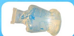
1 Sanisac ECO WC de 2,5 litres (à part)