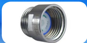
1 régulateur de débit douche (10 litres / minute)